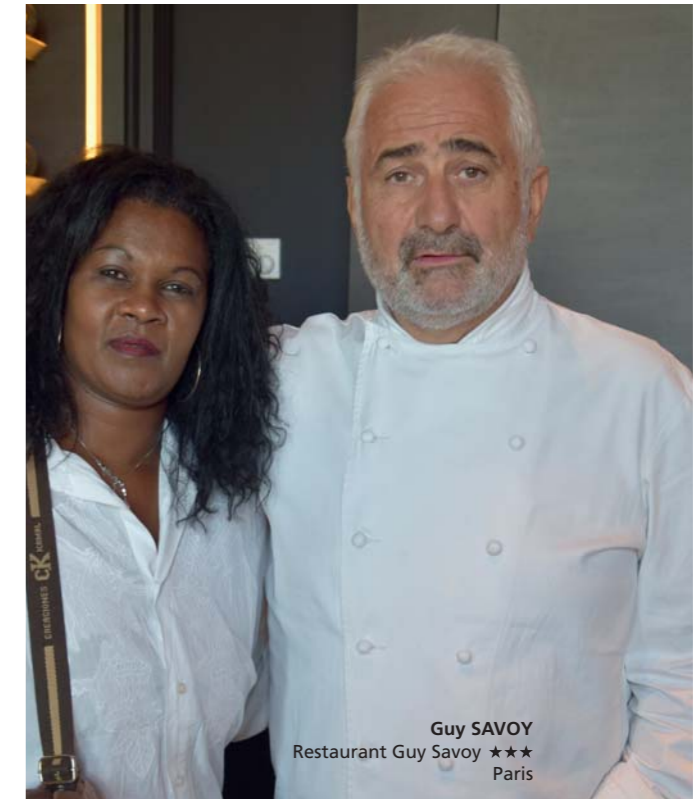
Guy SAVOY Restaurant Guy Savoy ★★★ Paris