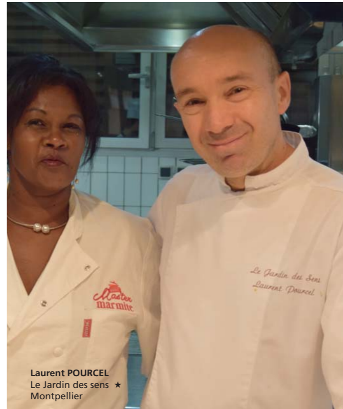
Laurent POURCEL Le Jardin des sens ★ Montpellier