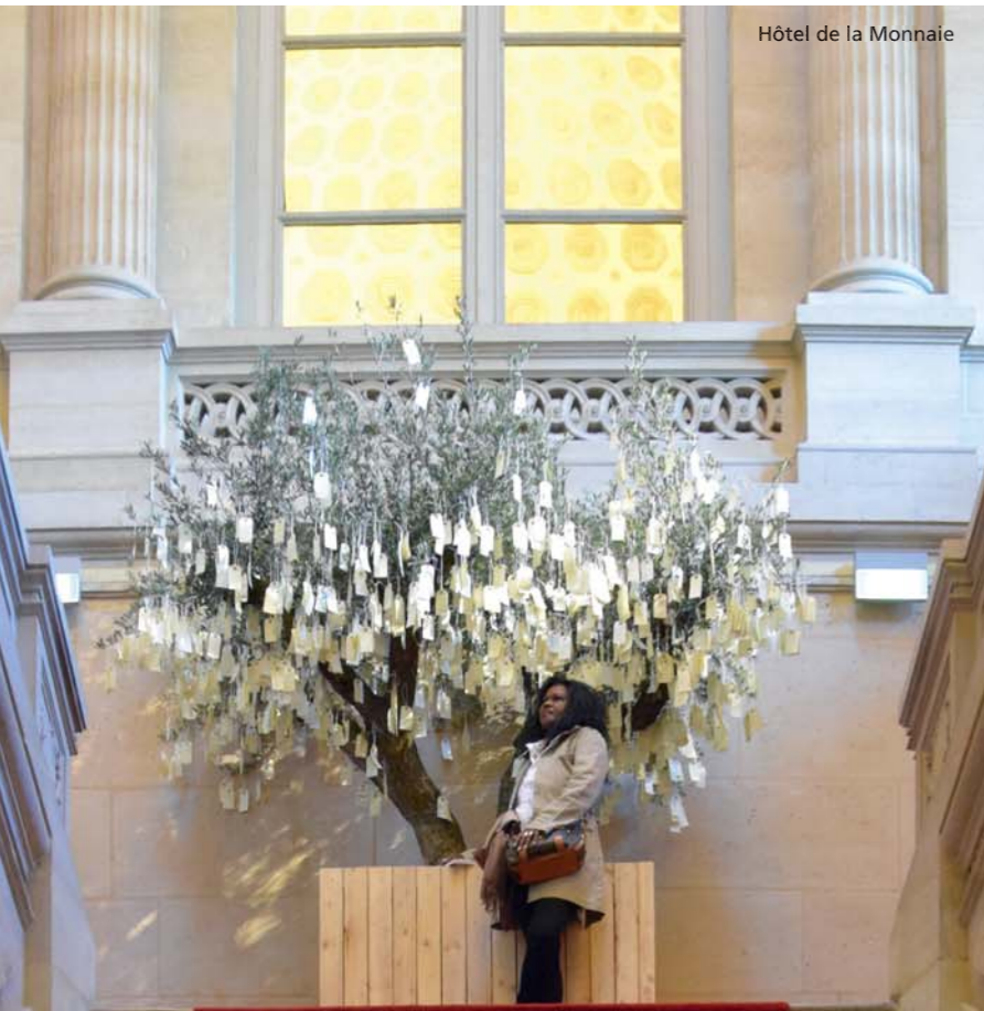
Hôtel de la Monnaie