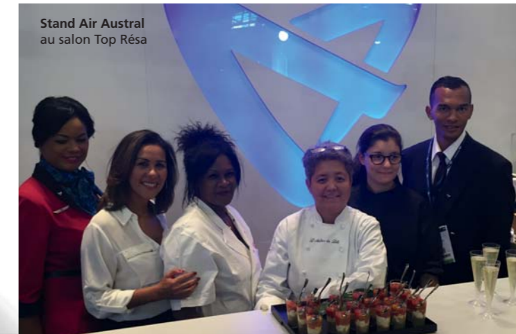
Stand Air Austral au salon Top Résa